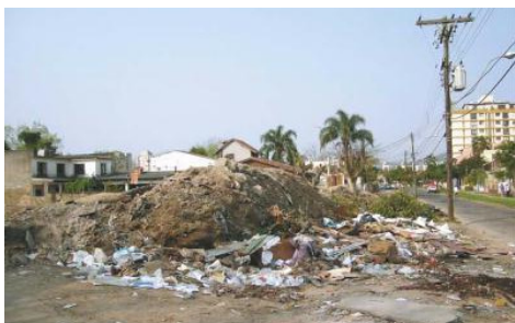
Figura 04- Foto do terreno.

A implantação do empreendimento vai garantir o fim desta prática irregular e a limpeza do sítio. Isto reduzirá os transtornos locais e a presença de animais que são atraídos pelos resíduos ali colocados irregularmente. Além disto, o paisagismo proposto vai agregar na biodiversidade local, tanto no terreno quanto nos passeios públicos. O sítio que hoje não possui nenhuma espécie vegetal espécies nativas, plantio de hortaliças e ervas aromáticas e bosque de árvores frutíferas .